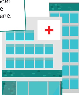
Krankenhaus mit Schwerpunktversorgung

Haben mindestens die Fachbereiche Chirurgie und Innere Medizin.